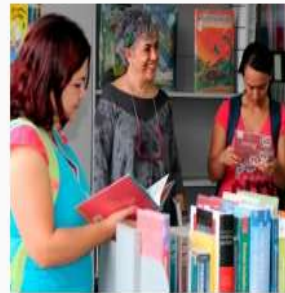
Biblioteca Pública Altavista