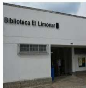
Biblioteca Público Corregimental El Limonar