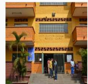
Biblioteca Público Escolar Granizal