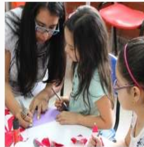
Biblioteca Pública Ávila