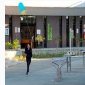
Biblioteca Pública El Poblado