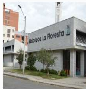
Biblioteca Público Barrial La Floresta