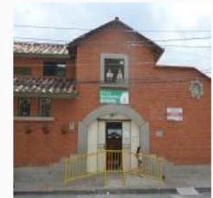
Biblioteca Público Corregimental San Sebastián de Palmitas