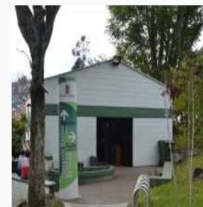
Biblioteca Público Barrial Fernando Gómez Martínez